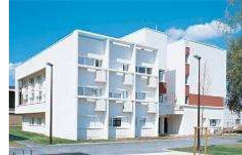
Bâtiment de 1500 m 2 SDP