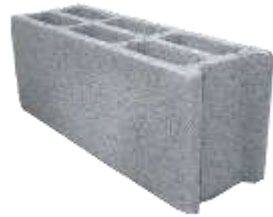
FDES (base INIES)

Méthode de calcul de l'impact carbone d'une ACV : Ex Murs blocs